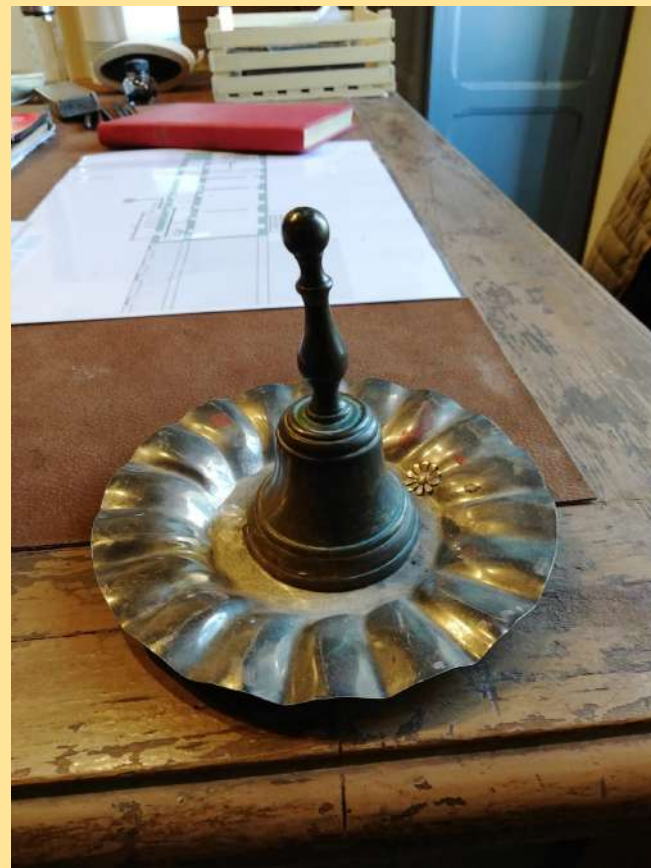
... lavagna, abito della maestra, campanellina...