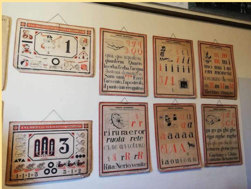
... cartelloni delle lettere e delle parole ....