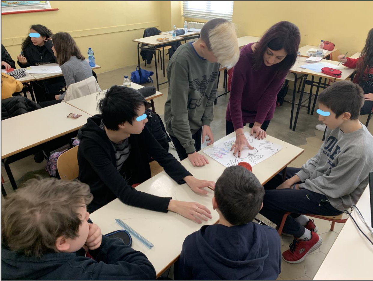
Momenti di lavoro